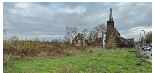
Boven: Weteringplein. Onder: Koetshuisplantsoen.

meente, nieuwbouwprojecten in Buytewech-Noord, Driekopenland fase 3 en een aantal andere nieuwe ontwikkelingen.